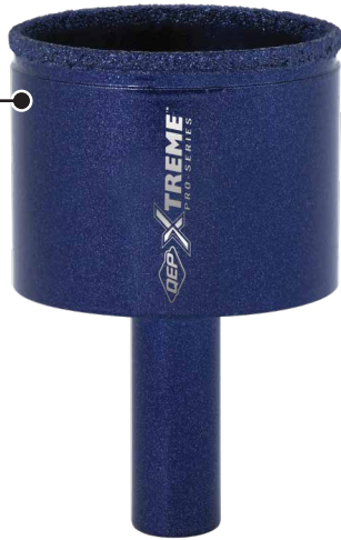
35 mm En Húmedo/En seco Broca corona diamantada