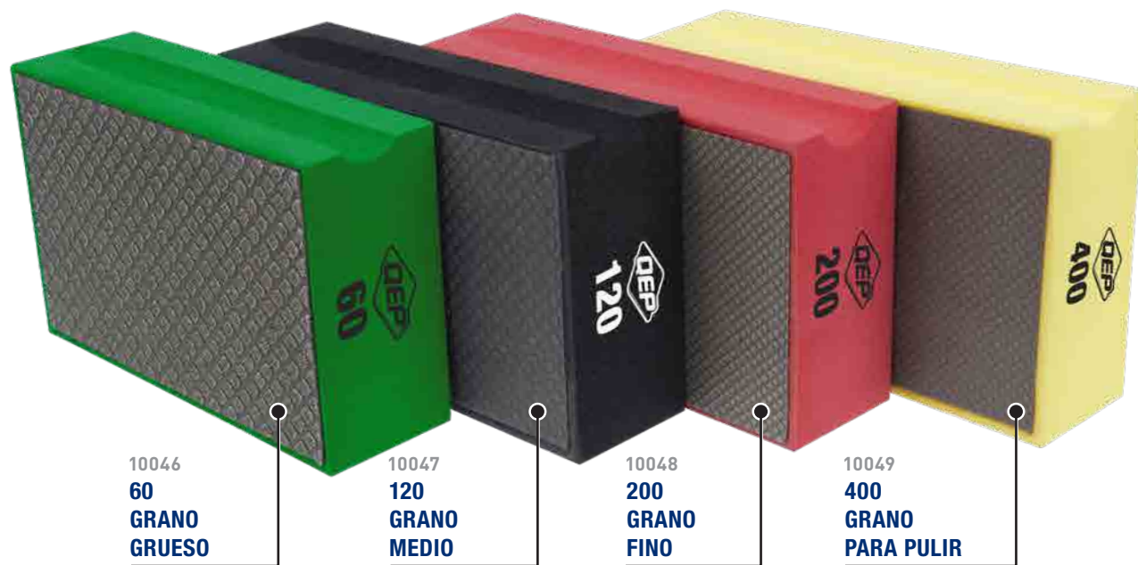
10046 60 GRANO GRUESO