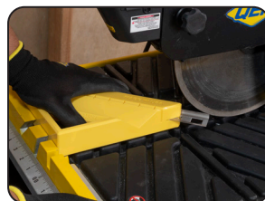
La ranura en el costado permite realizar cortes perfectos a un ángulo de 45° en los perfiles para losetas