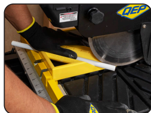
El biselado en "V" es para molduras lápiz y jolly

Plástico sólido y de alta calidad para resistir el desgaste diario