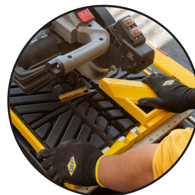
PARA USO CON SIERRAS HÚMEDAS Y SIERRAS CORTADAS